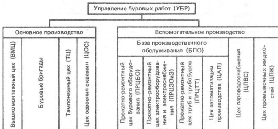
Рис. 1. Производственная структура бурового предприятия